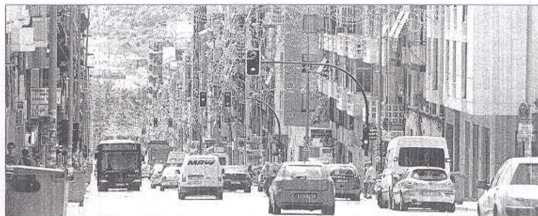
La Avenida de Novelda, donde próximamente empezarán las obras para facilitar la accesibilidad.